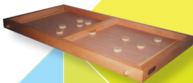
Table à Élastique

Posez les jetons en équilibre sur le rebord du jeu et propulsez-les d'un coup de pouce : le but étant de leur faire atteindre les cases qui comptabiliseront le plus de points.